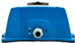
EV Charging Station Parte posteriore