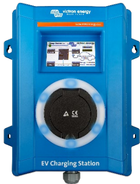
EV Charging Station